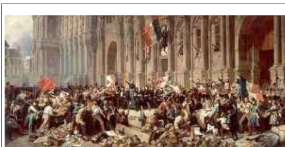
« Apparition du drapeau rouge à Paris en 1848 : les ouvriers s'affirment pour la première fois comme sujet politique et brandissent le drapeau rouge en opposition au drapeau tricolore. Lamartine le fit retirer en février ». (repris du blog Nuevo Curso).

montré les débuts de l'autonomie de la classe ouvrière, tant dans ses revendications que dans les objectifs qu'elle s'est fixés, ainsi que dans son organisation et son extension internationale. Le prolétariat international redécouvre ainsi la lutte de masse – que la gauche communiste considérait comme caractéristique de la nouvelle période du capitalisme, celle de l'impérialisme – et la nécessité et la possibilité d'une révolution prolétarienne mondiale, dans laquelle les masses ouvrières renverseront le capitalisme et créeront une société communiste.