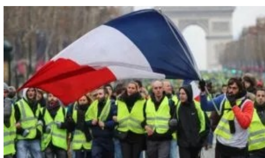
Manifestation des gilets jaunes sur les Champs-Élysées à Paris drapeau français en tête...

jaunes avaient réagi à des décennies d'échec du mouvement syndical et des partis soit-disant "ouvriers" (du PS et PCF jusqu'aux trotskistes et maoïstes) dans la défense des ouvriers face aux attaques contre leurs salaires, leurs conditions de travail, le chômage, les allocations et prestations sociales. Et au fur et à mesure que les revendications ouvrières se renforçaient, l'extrême-droite s'est retirée et Macron a été forcé de faire des concessions. Pour la première fois depuis des décennies, l'État a dû courber l'échine. Non en réponse à l'importance des "gilets jaunes" mais pour prévenir un mouvement massif des travailleurs. Ainsi, les ouvriers en gilets jaunes furent une phase, une étape au sein d'un mouvement plus large que les