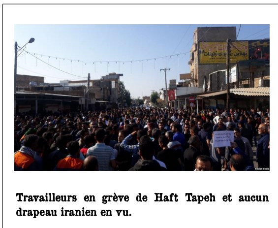
Travailleurs en grève de Haft Tapeh et aucun drapeau iranien en vu.

rues. Cela dépend des possibilités offertes par la lutte de masse pour résister aux forces de répression dans la rue. La rue est le lieu privilégié pour gagner le soutien d'autres travailleurs et de la population en général. D'autre part, nous avons vu en France que les travailleurs sont complètement encadrés dans les entreprises par le mouvement syndical reconnu par l'État. Dans les grèves des ouvriers de canne à sucre d'Half Tapeh (Khouzistan), un "syndicat libre" a joué un rôle mineur et la force du mouvement fut principalement les assemblées générales de travailleurs qui avaient élu et soutenaient les porte-paroles de leur comité de grève. Dans la lutte d'Haft Tapeh, malgré certaines restrictions, l'AG et un comité surmontèrent le manque d'organisation qui avait participé de que les manifestations de rue de décembre 2017-janvier 2018 aient été sanglantes. Par conséquent, non seulement l'existence de revendications politiques mais aussi la forme d'organisation et les propositions pour la création d'un Shora (un conseil ouvrier) offrent de plus grandes perspectives pour la lutte en Iran qu'en France où les syndicats ont encore un contrôle étroit sur les travailleurs.