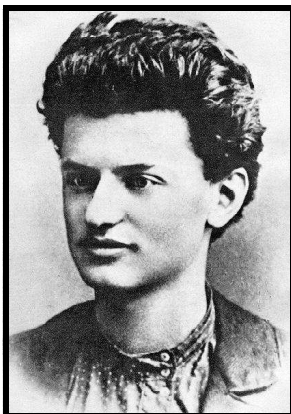
Trotsky en 1897

l'affaiblissement des conseils d'entreprise, pour ou contre une offensive politique sur la scène internationale. On échaffauda des théories pompeuses pour se concilier la bienveillance de la paysannerie, pour traiter des rapports entre bureaucratie et révolution, de la question du Parti, etc. Le summum fut atteint lors de la controverse Trotsky - Staline sur la "révolution permanente" et sur la théorie du "socialisme dans un seul pays".