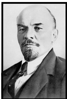
Lénine en 1918

Ce texte est extrait de: Trotsky, le Staline Manqué de Willy Huhn, (Spartacus, octobre-novembre 1981, Série B - N.113).