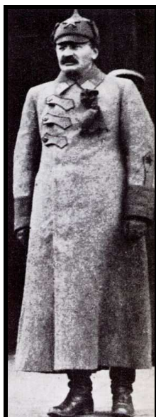
Trotsky en 1918

aspects fondamentaux, les trois systèmes sont identiques et ne représentent que des étapes différentes d'un même développement : chercher à renforcer par la manipulation de la masse de la population, grâce à un gouvernement dictatorial plus ou moins autoritaire, le règne des couches privilégiées que ce gouvernement protège, et rendre ce dernier capable de jouer sa partie dans le concert de l'économie internationale, par la préparation de la guerre, par la conduite de celle-ci, par l'utilisation des profits qui en résultent.