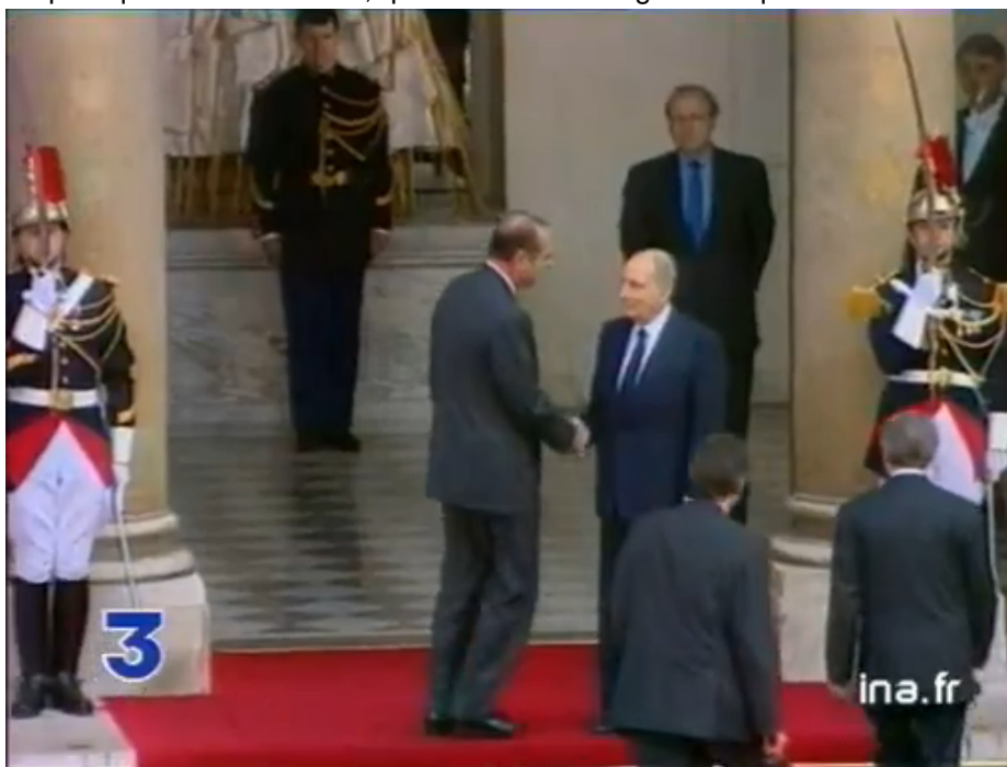
Passation de pouvoir Mitterrand Chirac en 1988

Quand la droite prend l'apparat du pouvoir, certaines classes sociales auront l'impression que tout ceci sera mieux géré, que les finances publiques s'amélioreront, que l'ordre social règnera et que la bureaucratie sera docile.