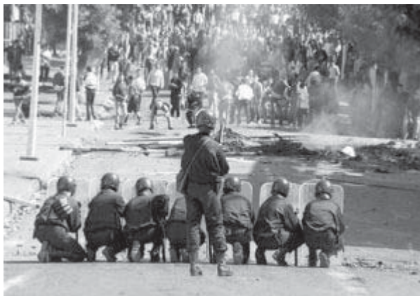
Mouvements insurrectionnels lors du soulèvement de l'Algérie en 2001.

approfondir l'économicisation de la vie sous ses catégories. Or, « il ne faut pas demander que l'on assure ou que l'on élève le "minimum vital", mais que l'on renonce à maintenir les foules au minimum de la vie » 4 , c'est-à-dire une vie qui ne soit pas « la réduction de la vie à une question de calories » 5 , un simple calcul nutritionniste, où le pauvre absolu est celui dont l'apport alimentaire reste au-dessous d'un minimum calorique défini. Cette manière d'opérer est un formidable appauvrissement