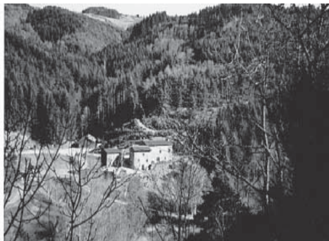
Le domaine de chasse privée de Raboulet dans la vallée de la Ramade en Auvergne

Car voilà comment une bande de contestataires avides d'autonomie et appuyés par différents usagers de la vallée (paysans, chasseurs, promeneurs, etc.), ont fait feu de tout bois – et c'est le cas de le dire – contre un projet de création d'une réserve de chasse privée pour touristes sur plusieurs centaines d'hectares ( http://domainederaboulet.com/Pages/biotope.html ), et voulant par là exproprier l'usage public des chemins vicinaux qui allaient alors la traverser. Mais rien là d'une banale affaire de voisinage, comme lors de ces manifestations qui ne critiquent que partiellement la société industrielle contre par exemple l'implantation de telle méga-décharge à côté de la dernière nappe pavillonnaire qui encercle tel ou tel village péri-urbain. C'est là, dans les articles, lettres ouvertes aux « responsables » (élus locaux, sous-préfet, écologistes, etc.), moqueries et invectives qui sont publiés à leur