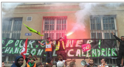
AG de Paris-Nord