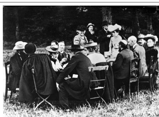
Prise de parole de Rosa Luxemburg lors d'une réunion du SPD en 1905

« Le devoir de protester contre l'oppression nationale et de la combattre qui correspond au parti de classe du prolétariat, ne trouve pas son fondement dans un quelconque "droit des nations" particulier tout comme l'égalité politique et sociale des sexes n'émane pas d'un quelconque "droit de la femme" auquel se réfère le mouvement bourgeois d'émancipation des femmes. Ces devoirs ne peuvent provenir que d'une opposition