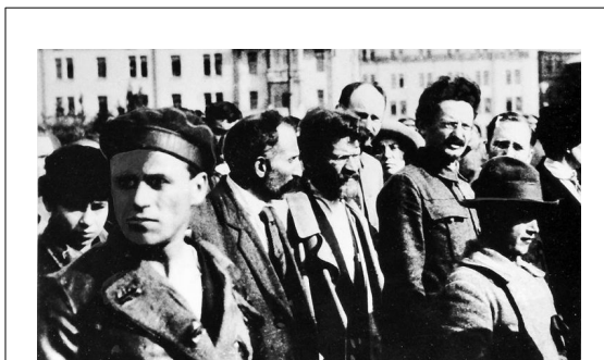
Le 6 e Congrès du Parti bolchevique qui eut lieu durant les Journées de juillet 1917, fut celui de la fusion avec le groupe inter-district du POSDR (le parti social-démocrate russe), le "groupe de Trotsky" que l'on voit sur la photo, et le début des adhésions massives des ouvriers. En mars 1918, après l'insurrection ouvrière d'octobre 17, le nouveau parti adopta le nom de "parti communiste". (repris du blog de Nuevo Curso).

« Une transformation massive des hommes s'avère nécessaire pour la création en masse de cette conscience communiste, comme aussi pour mener la chose elle-même à bien; or, une telle transformation ne peut s'opérer que par un mouvement pratique, par une révolution; cette révolution n'est donc pas seulement rendue nécessaire parce qu'elle est le seul moyen de renverser la classe dominante, elle l'est également parce que seule une révolution permettra à la classe qui renverse l'autre de balayer toute la pourriture du vieux système qui lui colle après et de devenir apte à fonder la société sur des bases nouvelles » (K. Marx, L'idéologie allemande 36 ).