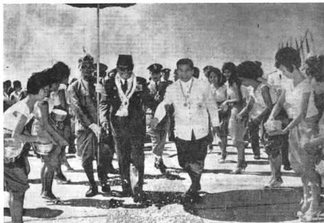
LE SPECTACULAIRE CONCENTRÉ

Dans la zone sous-développée du marché mondial , on rassemble dans l'idéologie et, à l'extrême, sur un seul homme, tout l' admirable étatique garanti, indiscutable, qu'il s'agit d'applaudir et de consommer passivement. La faible quantité des marchandises réellement disponibles tend à ramener cette consommation au pur regard. L'image du pouvoir, dans laquelle ce regard doit trouver tout son bonheur, est donc un fourre-tout des qualités socialement reconnues. Soekarno devait être à la fois un génial conducteur de peuple et un irrésistible séducteur de cinéma. Philosophe, il concentrait dans le concept de « Nasakom » le nationalisme, la religion et le « communisme » stalinien ; de même qu'il régnait à la Ben Bella, en fondant son autorité sur l'antagonisme évident de l'armée et du plus puissant parti stalinien d'Asie. Il veut continuer de tenir son « rôle unique » de représentant perpétuel de cette perfection hybride alors même que son armée a massacré, d'après lui, au moins 97.000 de ses communistes, et qu'elle continue. « Notre capacité d'arrondir les angles est telle, écrivait l'officieux Indonesian Herald après le putsch manqué du 1 er octobre, que, si Moscou et Pékin avaient adopté le système indonésien pour « résoudre » les problèmes, le conflit idéologique actuel entre les deux pays ne serait jamais devenu public. »