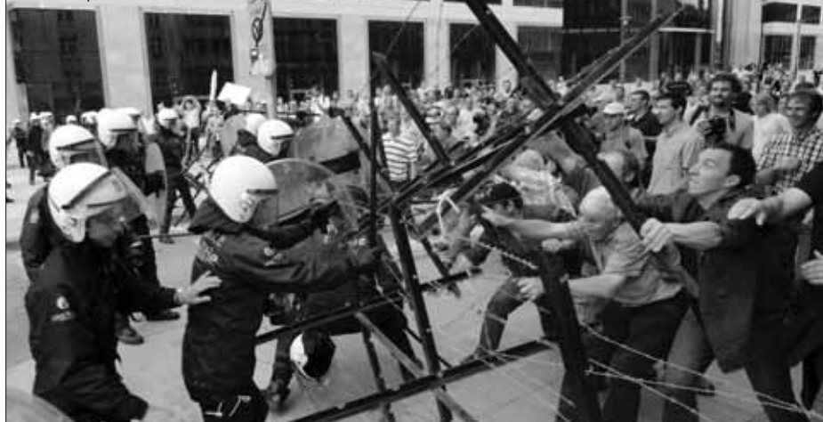
Bruxelles, 5 octobre 2009

La grève est suspendue le 29 septembre, dans l'attente de la réunion des ministres européens de l'agriculture, prévue à Bruxelles pour le 5 octobre. Cette rencontre au sommet ne donnera pas grand chose, à part la désignation d'une commission d'experts sur le problème, et un beau désordre en centre ville (axes bloqués, flics bombardés de foin, d'œufs et de bouteilles) ■