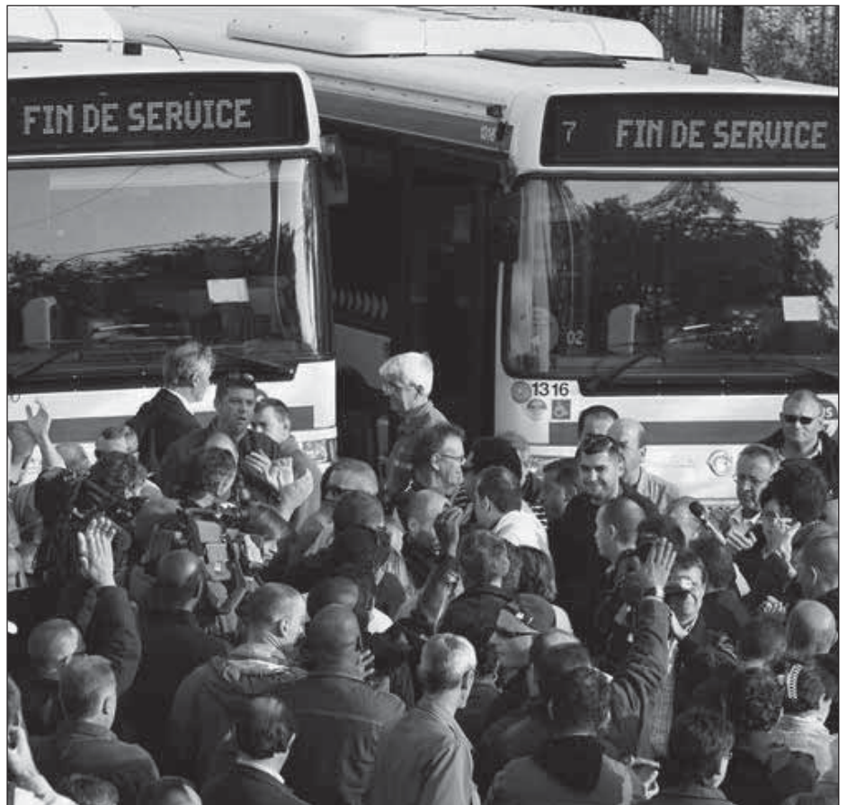
Grève des TCL - septembre 2009

« C'est la lutte maintenant, pour de bon, ou alors on est morts » Petite phrase prononcée sur le piquet du dépôt de La Soie