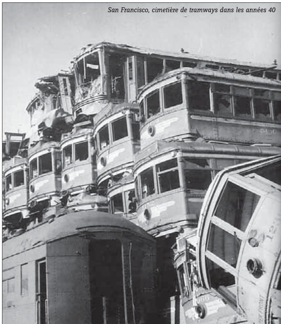
San Francisco, cimetière de tramways dans les années 40

En plus des journalistes et des élus, sarkozystes et usagers mécontents font pression pour le retour à la normale. Les médias locaux ont largement fait la pub pour le groupe Facebook « fuck TCL », qui aurait compté jusqu'à 7900 membres sur la fin du mouvement. Suite à un appel pour une manif anti-grève le 3 octobre, ces milliers d'internautes aigris se sont transformés en 150 manifestants éparpillés sur la place Bellecour, et pas vraiment à l'aise : on pouvait trouver pêle-mêle un élu du MPF (parti de De Villiers) venu « défendre les braves gens et les enfants qui ne peuvent plus aller à l'école » ; une cinquantaine de jeunes UMP ou de membres de l'UNI gueulant pour un service minimum obligatoire ; des étudiants en école de commerce et des bourgeois décomplexés fustigeant les « nantis des TCL qui veulent empêcher ceux qui ont su garder leur travail pendant la crise d'aller travailler »... Une employée de maison, un peu égarée parmi ce beau linge et tous ces fafs, se lamente : « C'est dommage que cela soit toujours noyauté. Quand est-ce qu'on arrivera à se débrouiller vraiment seuls en tant que citoyens ? » Vaste problème, puisque le propre du citoyen