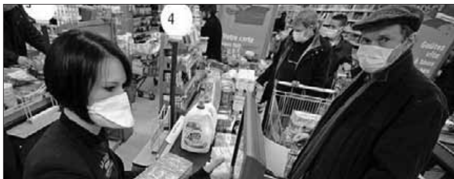
Grigny, simulation de pandémie de grippe aviaire, printemps 2009

Et si pour l'instant, on suggère gentiment aux gens d'aller se faire vacciner (des lettres devraient bientôt partir pour tous les assurés sociaux, les invitant à réfléchir sérieusement au passage par la case vaccin), la pression se fait déjà plus pesante sur les « professionnels de santé », qui rechignent plus ou moins à se faire piquer. Alors on fait jouer la responsabilité, et en ligne de mire la culpabilisation « En tant qu'infirmière, vous imaginez si vous transmettiez le virus à des enfants ? », « Comment pourrait-on se passer du personnel médical s'il faut soigner la population ? ». D'autres en appellent au devoir, de conscience ou professionnel. On tente de définir les populations « prioritaires » sans froisser personne : les pompiers, policiers, gendarmes, et les personnes à risques. Des médecins ou infirmiers retraités pourraient également être rappelés, par manque de personnel à piquouse. L'étape d'après ? La vaccination obligatoire, qu'on sent venir au loin. A Lyon, on envisage de mettre en place des centres mobiles de vaccination, qui quadrilleraient l'espace pour distribuer la dose miracle (qui n'a pas encore été testée à fond). Par mesure de police sanitaire, la circulation et le rassemblement de personnes pourraient être limités.