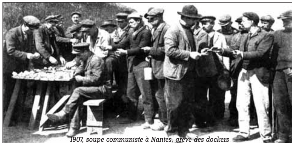
1907, soupe communiste à Nantes, grève des dockers

Parmi ces possibles, se pose aussi la question des syndicats et de notre rapport à eux. Certes les syndicats brident la plupart du temps les luttes et les mouvements, on connaît l'histoire. Mais considérer les syndicalistes a priori comme des connards, c'est passer à côté de quelque chose. C'est s'imaginer qu'un syndicaliste n'est que ça, qu'il le porte dans tout ce qu'il fait, dans tous ses choix. Ça fige une fois encore les identités. Et c'est certainement pas en dénonçant les « syndicalistes-flics » qu'on contribue à ce qu'ils soient autre chose. Car ce qui importe, ce sont les déplacements qui peuvent s'opérer derrière les étiquettes syndicales : comment des syndicalistes, en situation (de lutte exacerbée, face à une direction très hostile) embrayent sur des pratiques radicales qui dépassent celles du syndicalisme classique (blocage des flux de l'économie, assumer devant les « usagers » de bloquer la vie normale, s'affronter aux policiers et aux vigiles, etc.). La rencontre est possible et probable si on s'ouvre et si on ne se complait pas avec facilité dans la gestuelle de la radicalité, si on s'agence avec les déplacements identitaires que la lutte produit, chez les gens en lutte et chez les syndicalistes, qui peuvent devenir tout autre chose que ce qu'on croit savoir d'eux.