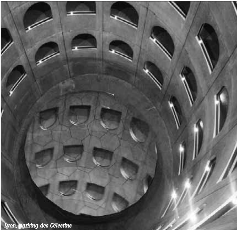
Lyon, parking des Célestins

métropole. Et qui plus est, en se payant le luxe de nous faire prendre l'affaire comme de la subversion.